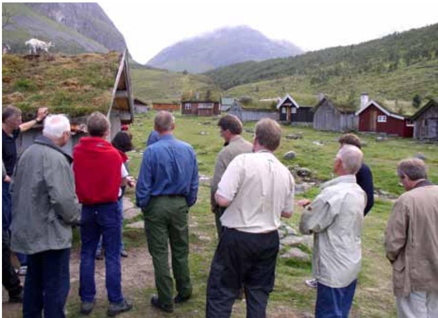
Gjester på Herdalssetra