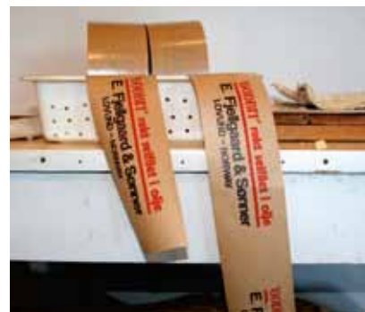
Merkelappene fra den andre produksjonsperioden

luke i gulvet ved overgangen til isrommet.