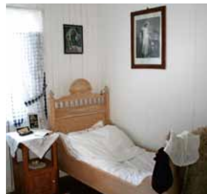
Kammerset i Kystkultursenteret