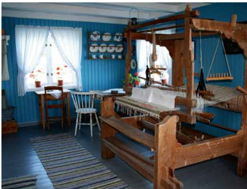
Kjøkkenet i Kystkultursenteret

Nå hadde Godbiten fått glassemballasje og lokket nytt design, tegnet av en slektning. "E. Fjellgaard og sønner" sto det trykt på lokket. Emballasjen måtte kjøpes inn i stort, minimum 100 000 glass og lokk. Glassene ble kjøpt inn fra Fredrikstad, lokkene fra England. Den store mengden emballasje skapte plassmangel og behov for å bygge på brygga. Andre etasje ble