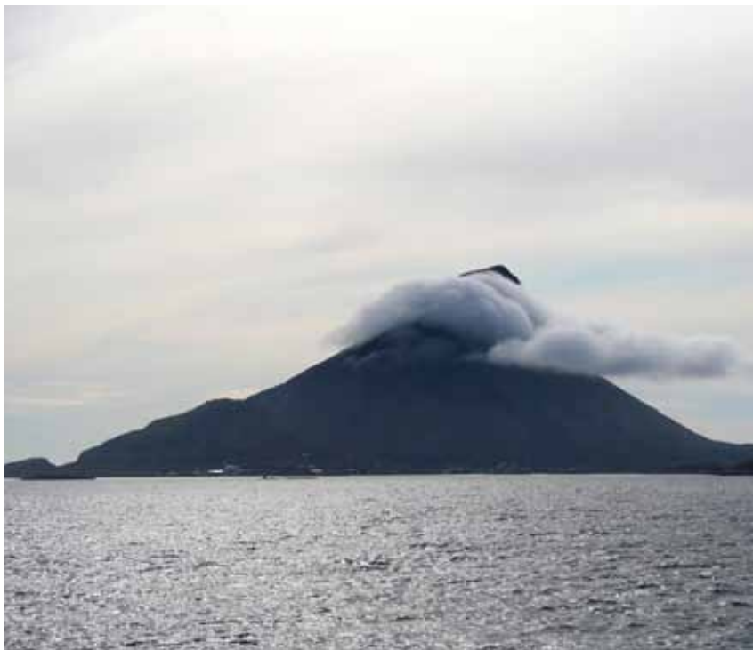
Lovund i Lurøy med Lovundmdfjellet

Som så mange andre bygninger har den gamle brygga på Lovund gått fra å være produksjonslokale til et senter for opplevelse, en framstilling av fortida. I brygga kan vi ikke lenger oppleve produksjon av seilaksen, men tekst, bilder og gjenstander bidrar til å indikere hvordan det foregikk. Lovund er likevel et dynamisk samfunn, med befolkningsvekst, null arbeidsledighet og ventelister i barnehagen. Et samfunn nå forankret på oppdrettsnæring.