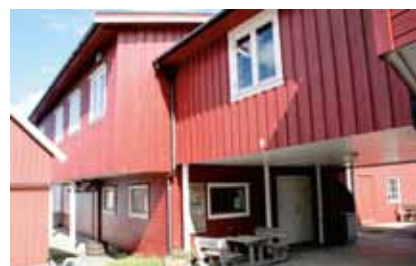
Fjellgaardbrygga slik deler av den ser ut i dag, som kystkultursenter. I annen etasje til venstre ble seilaksen lagt i olje

sund. Lovundproduktet fikk navnet "Godbiten".