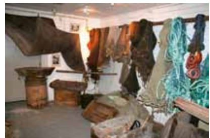
Fiskeredskap. Minner fra en svunnen tid

og Naustholmen. Bedriften besto av fiskemottak og anlegget for produksjon av Godbiten. I 1972 hadde den virkelige laksen, oppdrettslaksen, gjort sitt inntog på Lovund. Også Fjellgaard satset etter hvert på oppdrett. Til slutt flyttet de også all virksomheten til Naustholmen.