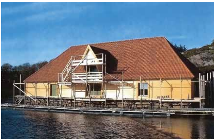
Stiftinga Trellevik kystkultursenter, Steinsland i Sund kommune, Hordaland

En kan ikke annet enn å bli imponert av resultatene som fremkommer gjennom aksjonen som Norsk Kulturarv står bak. "Ta et Tak" er nok en gang en braksuksess takket være midler fra Stiftelsen UNI på 500 000 kroner og Nordenfjeldske Bykreditts Stiftelse på 400 000 kroner. Sammen med tilskudd på 550 000 kroner fra Norsk Kulturarv og en formidabel dugnadsinnsats har en rekke unike kystmiljøer blitt vernet fra forfall.