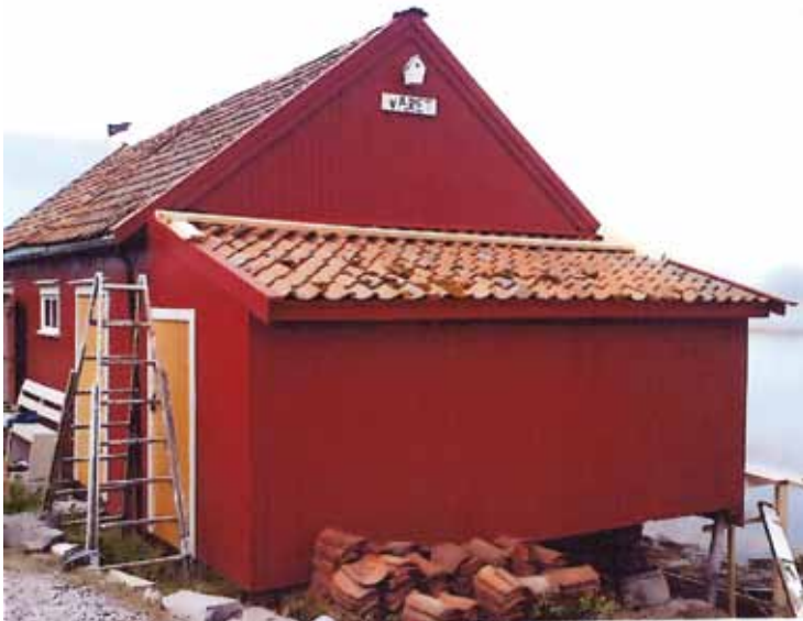
Egnesjå på Averøy, Møre og Romsdal