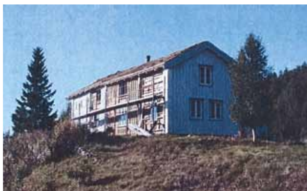
Eier: Karl Skålbones, Steintjønnlia, Rana, Nordland

Tilskuddet vil bli utbetalt når Norsk Kulturarv mottar dokumentasjon av det ferdigstilte arbeidet innen en gitt frist. Med dokumentasjon menes en kort beskrivelse av utført arbeid og minimum 2 bilder som viser arbeidet som er utført. Søkere som ikke dokumenterer ferdigstilling av arbeid innen fristen vil ikke ha krav til å få tilskuddet utbetalt.