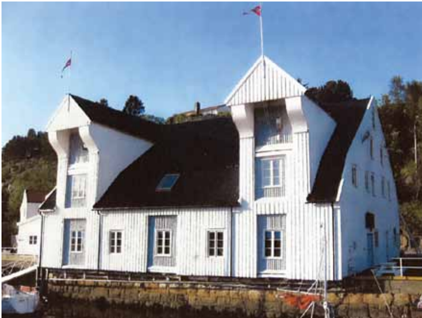
Nytt tak på Småbåtbygga, Kristiansund