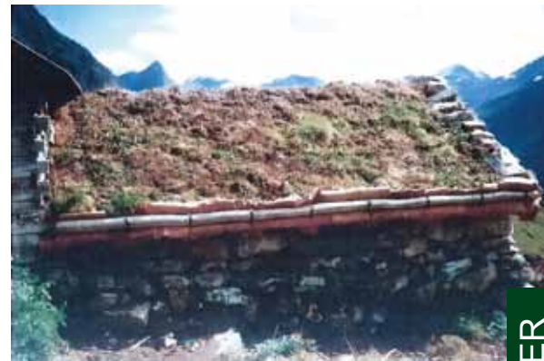
Arsetfjosen på Haugsetsætra i Geiranger, Møre og Romsdal

ter, og totalt 865 000 kroner er utbetalt så langt. En rekke søkere (23 ) har meddelt at de ikke greide å ferdigstille prosjektene innen tidsfristen 31.12.08. Årsakene er enten sykdom eller problemer med å skaffe kompetent arbeidskraft. Norsk Kulturarv har innvilget søknadene og gitt utsatt frist til høst 2009 for alle søknader på dette grunnlaget. Norsk Kulturarv er mer opptatt at kulturarven bevares enn en stram praktisering av frister. Etter konferanse med Norsk Kulturminnefond har vi erfart at samme praksis håndheves der.