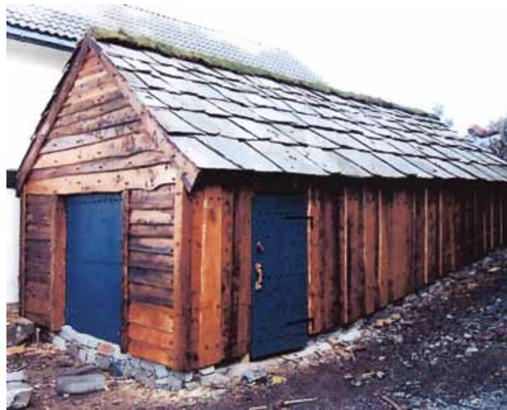
Naust, Bremnes, Hordaland