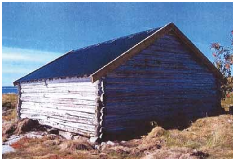
Melland Oppigarden, Aure, Møre og Romsdal