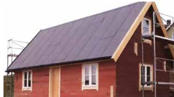
Eier: Åse Winsents, Kongsfjord, Finnmark